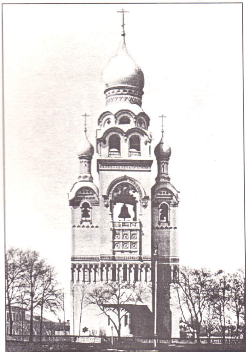
Колокольня, сооружённая в память распечатания алтарей храмов Рогожского Кладбища.