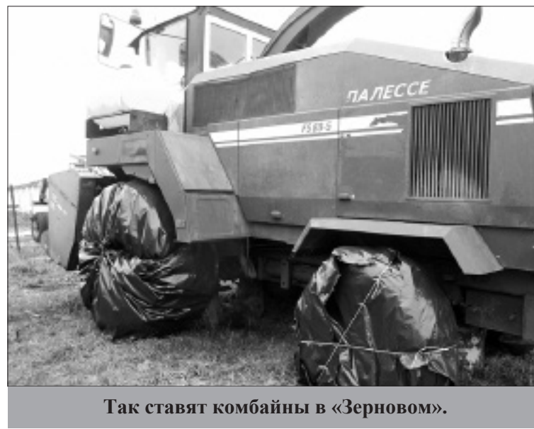
Так ставят комбайны в «Зерновом».