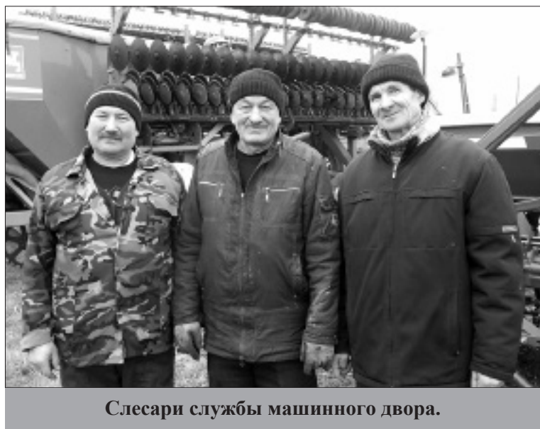
Слесари службы машинного двора.